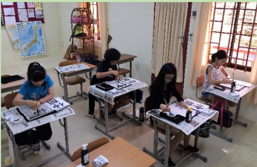
しょう5・教科書クラス