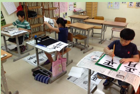
しょう3・教科書クラス

他のクラスも、小1と小2は硬筆で、小3以上は毛筆で、それぞれのお手本を見ながら、丁寧に書き上げ、立派な作品が出来上がりました。作品は、卒業式の時に展示する予定です。ぜひご覧ください。